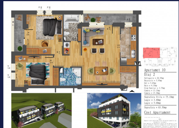
Apartment 10 Etaj 2 Sufragerie = 26.95mp Bucatarie = 5.95mp Hol = 5.45mp Bai = 4.35mp Grup Sanitar = 3.75mp Camera = 13.35mp Camera = 15.30mp Suprafata Utila = 75.10mp Logie = 3.40mp Suprafata = 83.50mp Cost Apartament